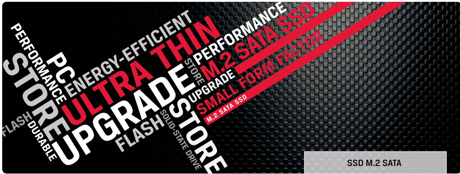
SSD M.2 SATA